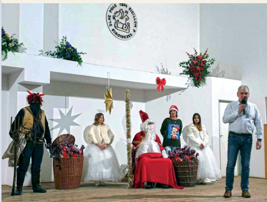
Mikuláša s pomocníkmi privítal starosta obce Dlhé Pole.