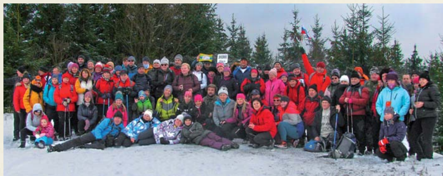
Tradičný výstup na vrch Javorník v Dlhom Poli.