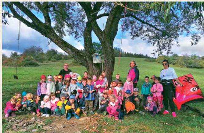
Výlet škôlkarov do jesennej prírody.