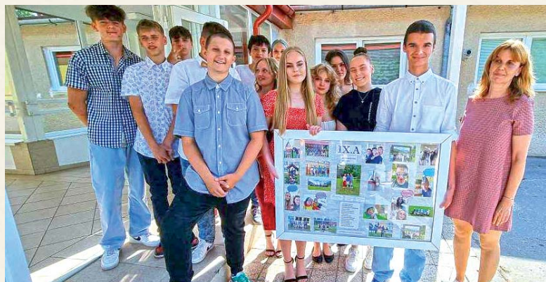
Na konci školského roka sa deviatci lúčili so základnou školou.