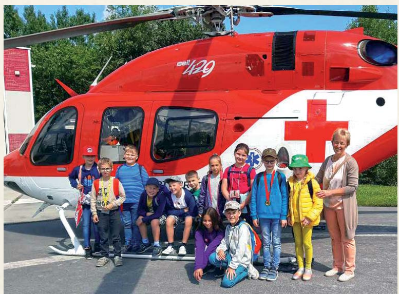
Žiaci 3.A navštívili v júni Vrtuľníkovú záchranú službu v Žiline.