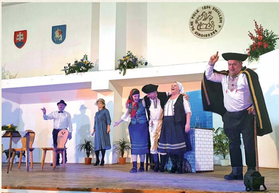
Divadelné predstavenie Ženský zákon pobavilo divákov.