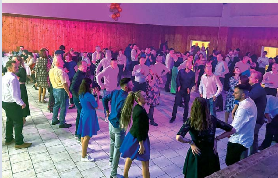
Pohodová zábava vždy zaplní tanečný parket kultúrneho domu.