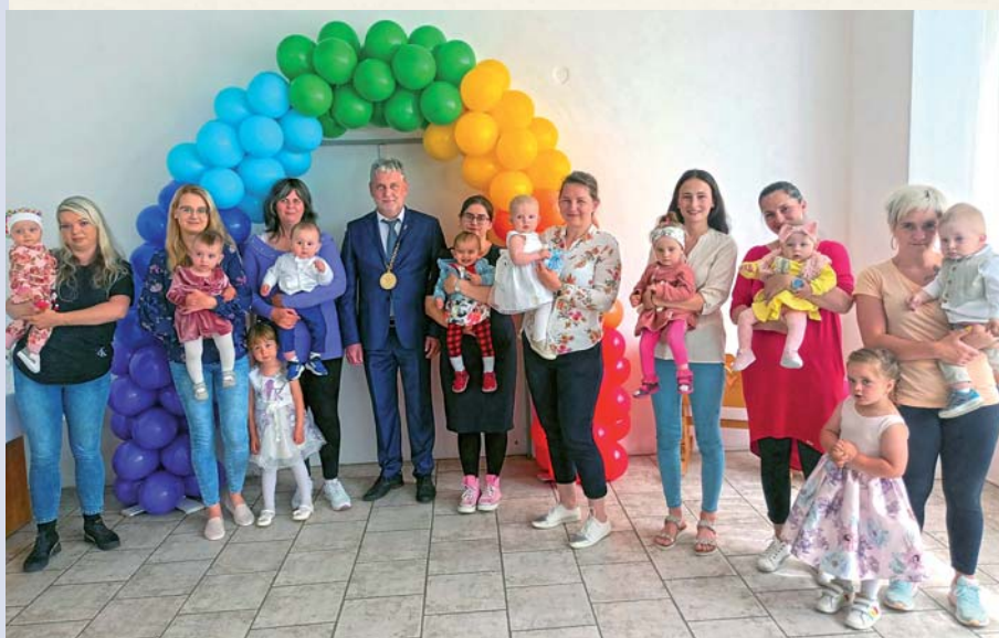
Uvítanie detí do života prebehlo v kultúrnom dome.