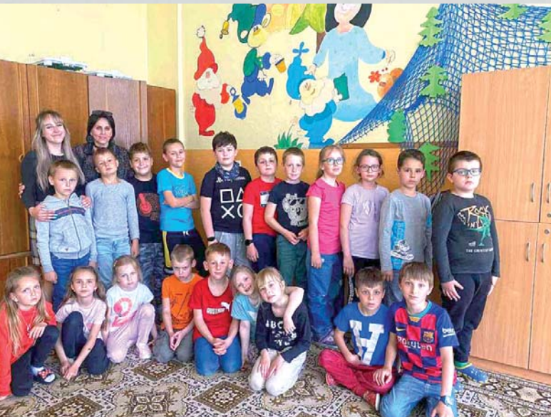
V ŠKD sú základom priateľské vzťahy.