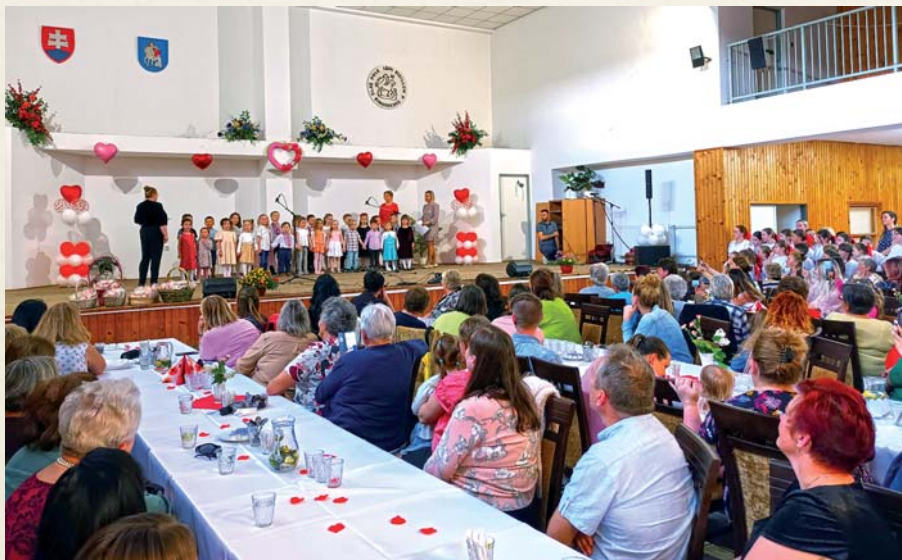
Deti z materskej školy potešili publikum na Deň matiek.