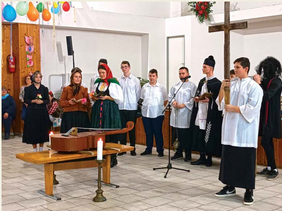
Tradičné pochovávanie basy v podaní žiakov ZŠ v Dlhom Poli.