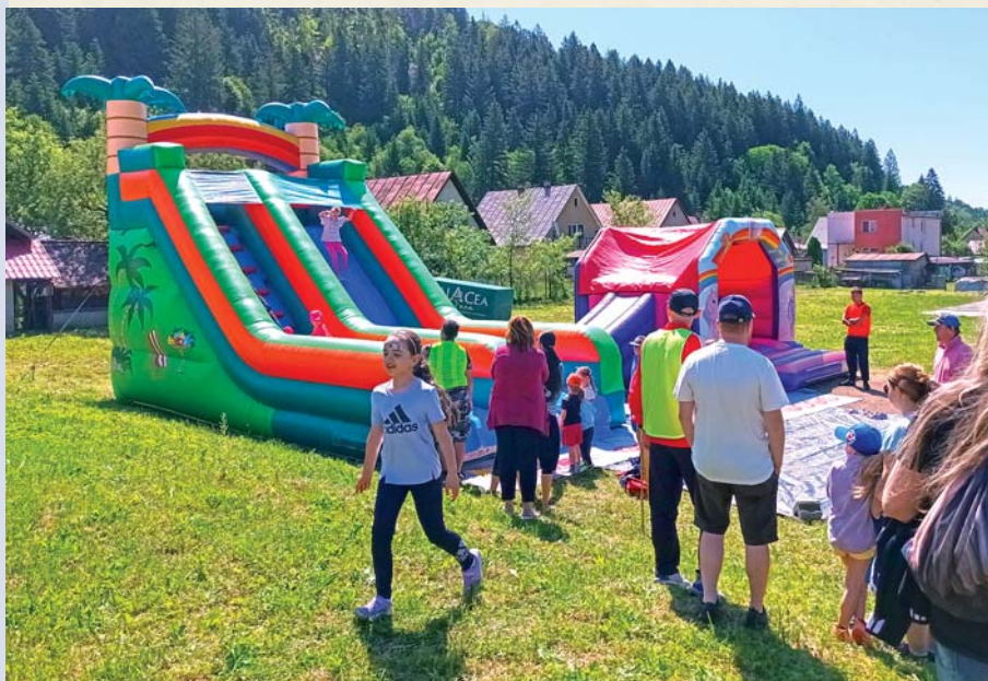
Na Športovom dni detí na ihrisku základnej školy je vždy zábava.

Obecný úrad nezabúda na najmenších obyvateľov a pravidelne organizuje Uvítanie detí do života. V minulom roku sa tradičné podujatie konalo vo štvrtok 8. júna 2023 v kultúrnom dome. Na slávnosť boli pozvaní rodičia trinástich detí (piatich chlapcov a ôsmich dievčat), z ktorých väč-