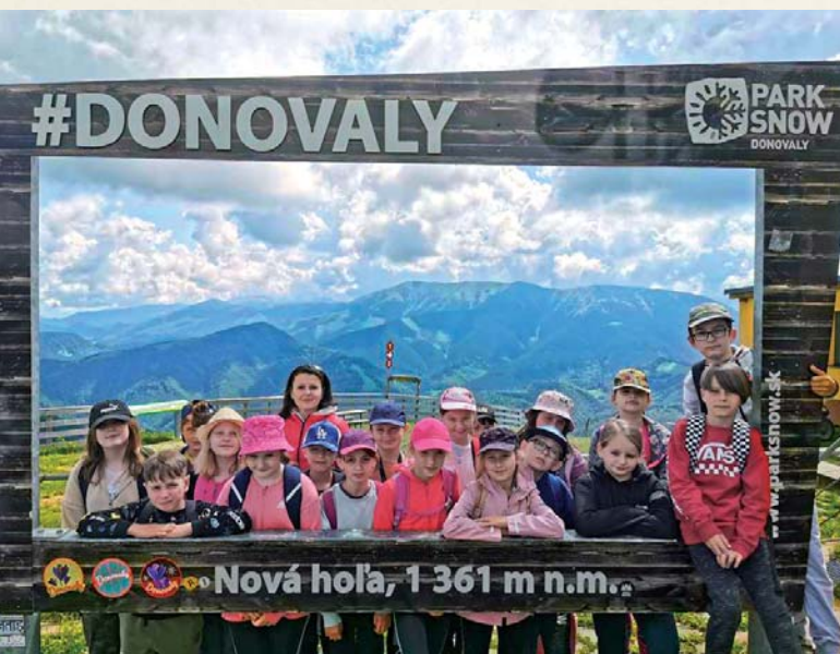
Štvrtáci v škole v prírode na Donovaloch.