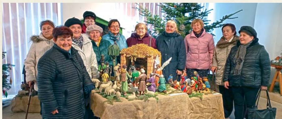
Členky ZO SZTP na návšteve kaplnky Budatínskeho hradu.