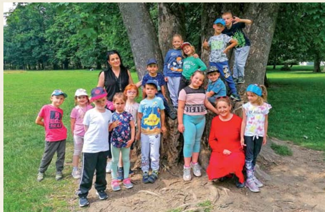
Predškoláci v Budatínskom parku.