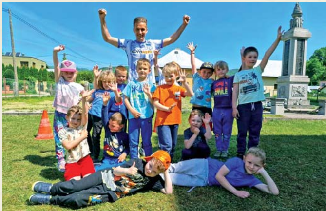
Deti potešila návšteva futbalového reprezentanta Petra Pekaříka.