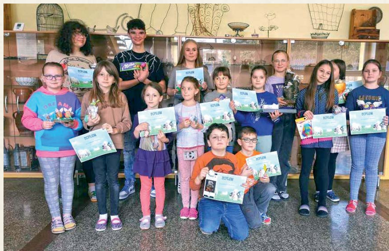
Do súťaže O najkrajšiu kraslicu sa zapájajú žiaci z 1. aj 2. stupňa.