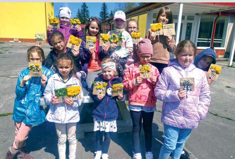
K mnohým aktivitám patrí aj spoznávanie prírody. Deti s originálnymi kyticami.