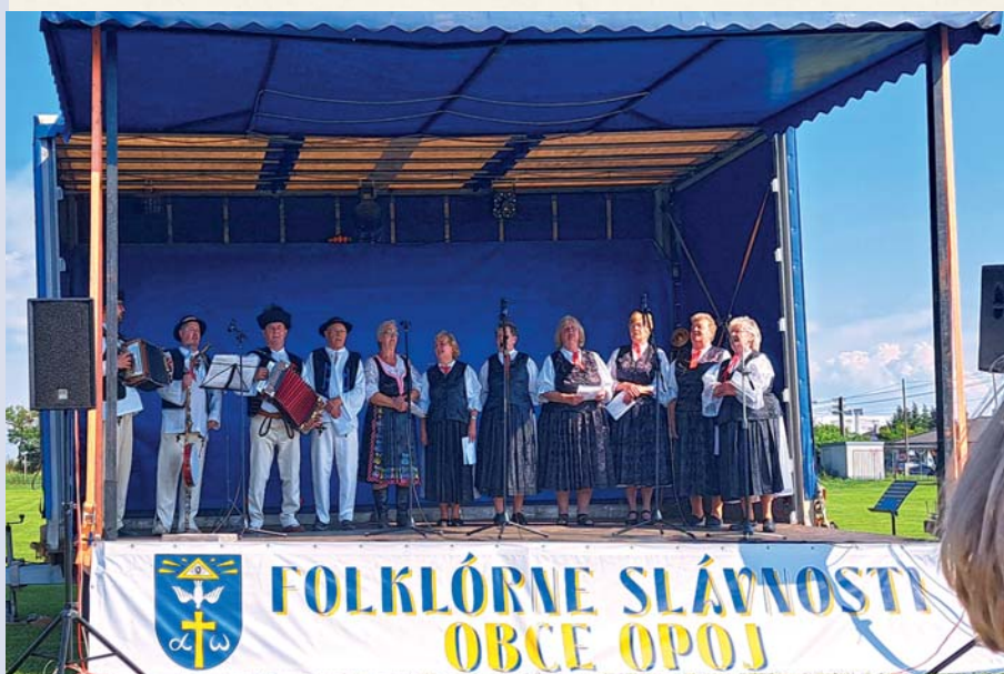
Folklórna skupina Drotár vystúpila 17. 6. 2023 na Folklórnych slávnostiach v družobnej obci Opoj.