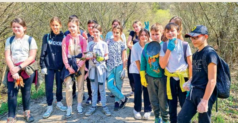
V rámci Dňa Zeme čistia žiaci okolie školy aj obec. Na zábere piatáci a šiestaci.