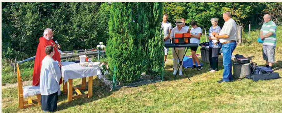
Sv. omša pri Kríži na Stolečnom v septembri 2023.