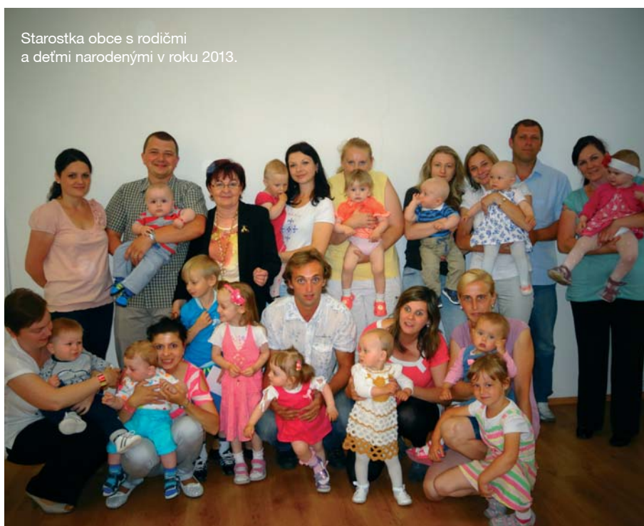
Starostka obce s rodičmi a deťmi narodenými v roku 2013.