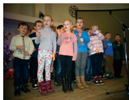
Vystúpenie detí zo ZŠ s MŠ v Dlhom Poli.