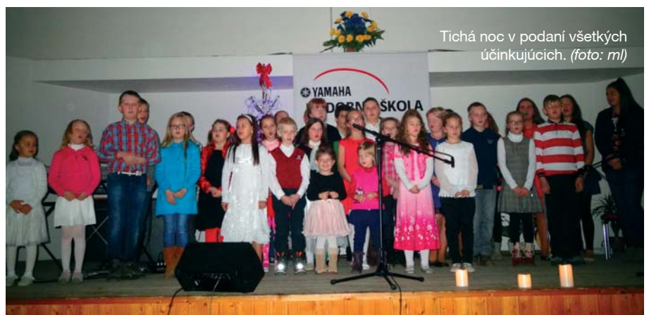
Tichá noc v podaní všetkých účinkujúcich.