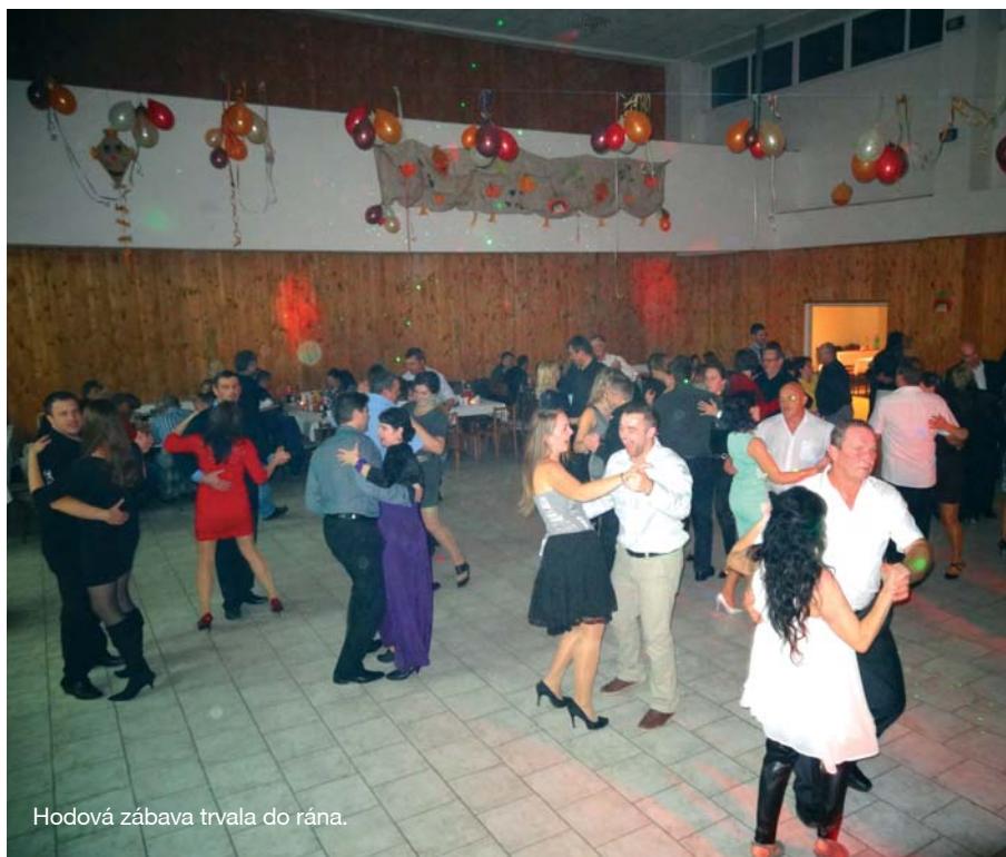
Hodová zábava trvala do rána.