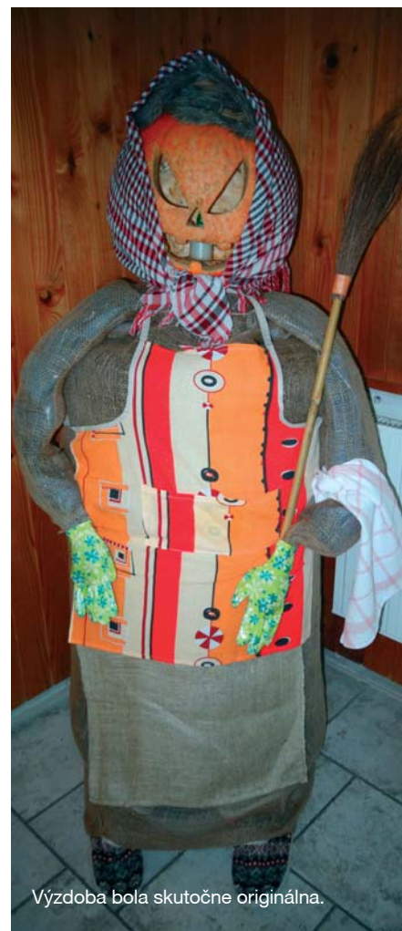
Výzdoba bola skutočne originálna.

hudby a nechýbala ani chutná večera. Po polnoci sála spozornela a všetci čakali na vyhlasovanie tomboly, o ktorú sa postarali miestni sponzori. Nasledoval krátky program, do ktorého sa zapojila väčšina zúčastnených. Kapela zabávala publikum takmer do rána a prisľúbila účasť i na budúci rok. Organizátori sa už teraz môžu tešiť na veľkú účasť, veď Hodová zábava je z roka na rok vydarenejšia.