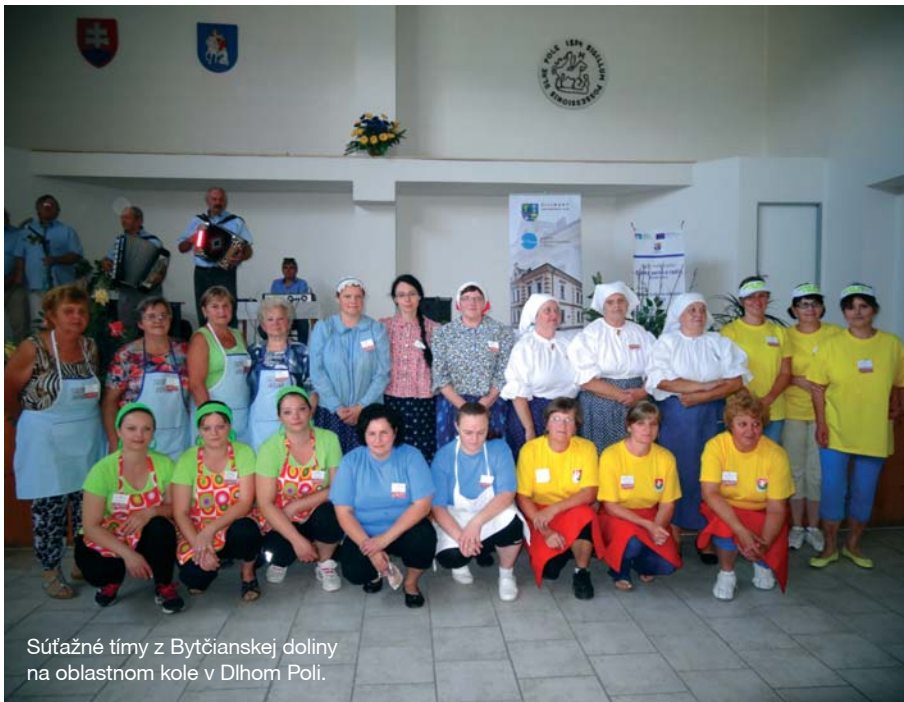
Súťažné tímy z Bytčianskej doliny na oblasťnom kole v Dlhom Poli.