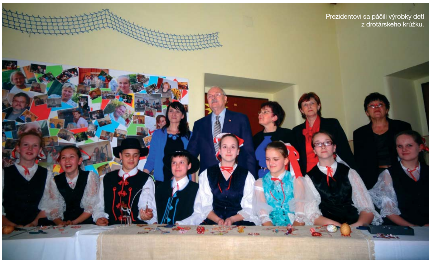
Prezidentovi sa páčili výrobky detí z drotárskeho krúžku.