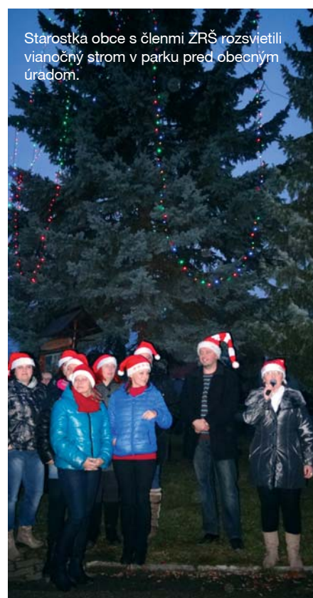
Starostka obce s členmi ZRŠ rozsvietili vianočný strom v parku pred obecným úradom.