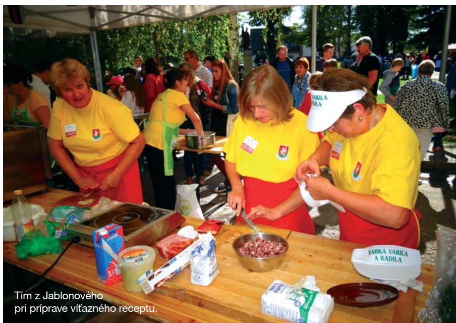
Tím z Jablonového pri príprave víťazného receptu.