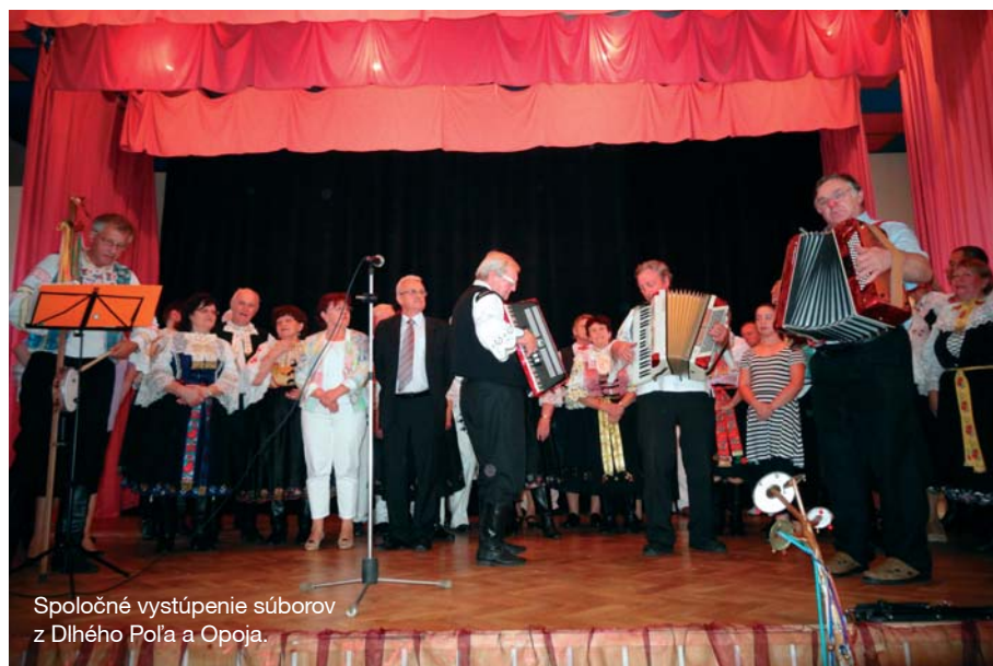
Spoločné vystúpenie súborov z Dlhého Poľa a Opoja.

Po príjemnom dni nebolo ľahké odísť. Medzi občanmi oboch obcí totiž vznikli priateľstvá, ktoré preklenú aj dialku. Lúčeniu teda nebolo konca – kraja a medzi stiskami rúk a vrúcnymi objatiami sa leskli aj slzy v očiach. Všetci sa však zhodli na tom, že v tradícii treba pokračovať a po poslednej piesni znelo z oboch strán sľubné dovidenia.