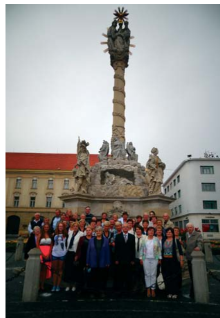
Dlhopolčania na Trojičnom námestí v Trnave.