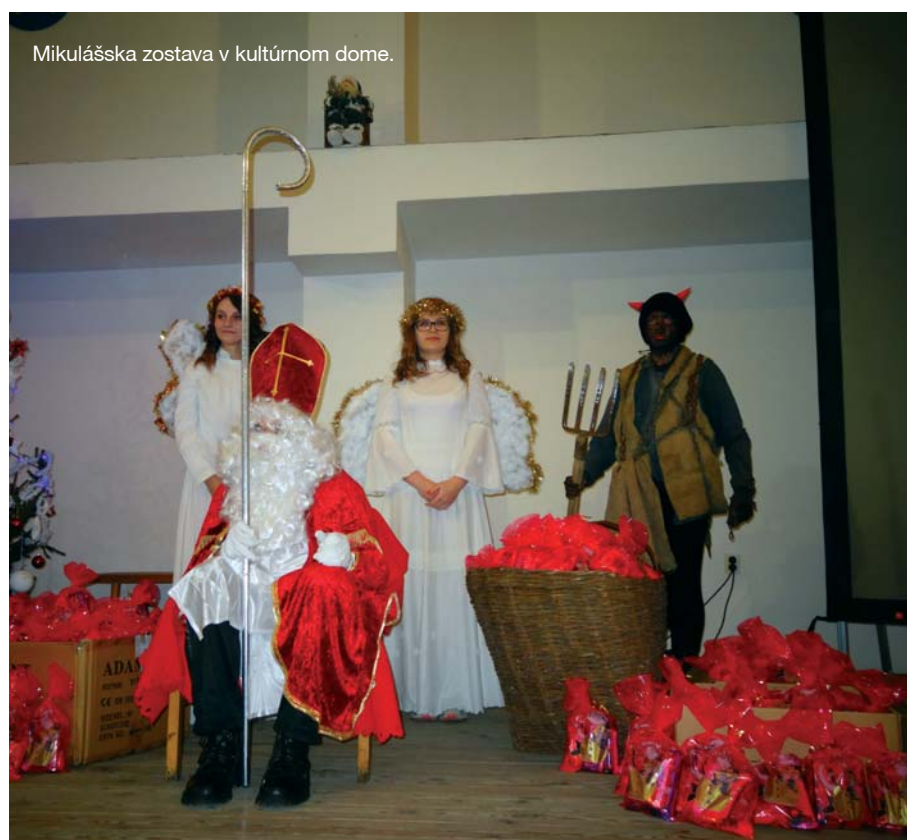
Mikulášska zostava v kultúrnom dome.