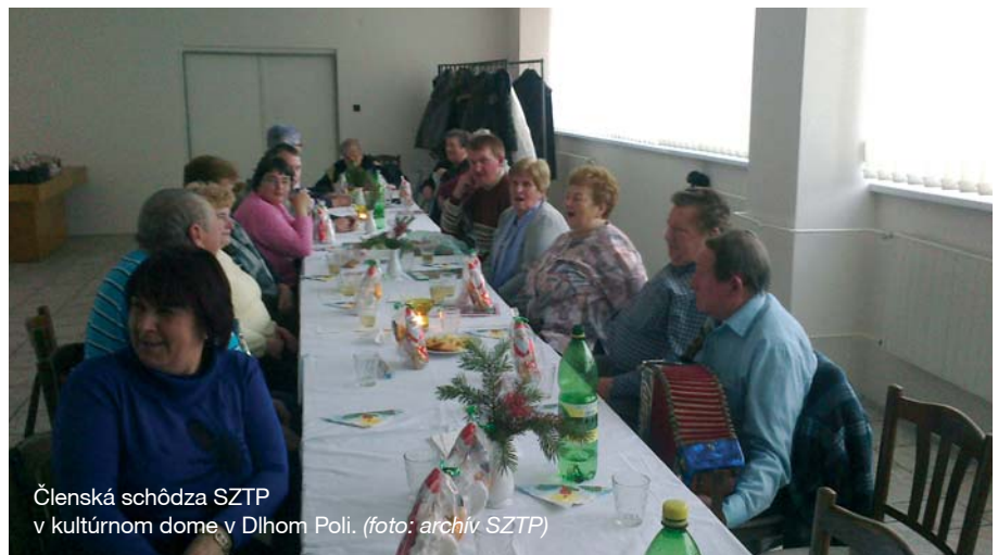
Členská schôdza SZTP v kultúrnom dome v Dlhom Poli.