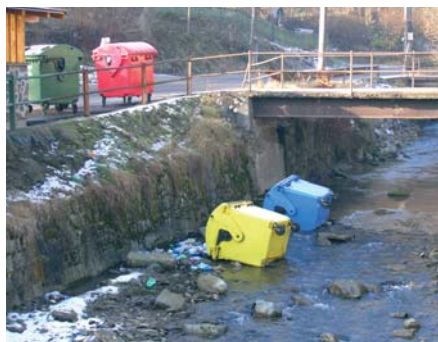
Prevrhnuté kontajnery v rieke pri zastávke pri Mlyne.