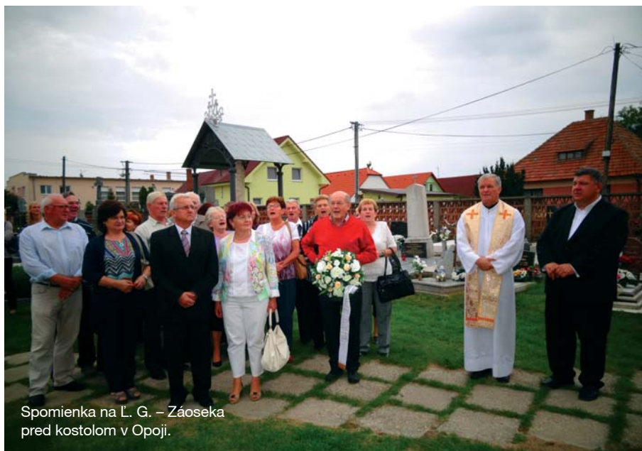
Spomienka na L. G. – Záoseka pred kostolom v Opoj.