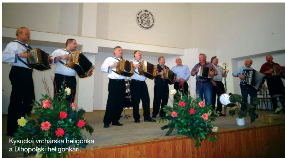
Kysucká vrchárska heligonka a Dlhopoľskí heligonkári.

heligonke. Oblúbená skupina rozospievala celú sálu a zábava pokračovala vystúpením Dlhopoľských heligonkárov. Po sladkom občerstvení nasledoval hlavný bod programu a na pódium sa zišli obe skupiny spoločne. Publikum bolo nadšené, známe