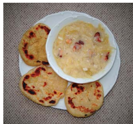
Dlhopolské osúchy s kyslou kapustou postúpili do finále súťaže.