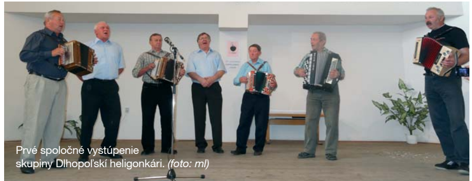
Prvé spoločné vystúpenie skupiny Dlhopolští heligonkáři.