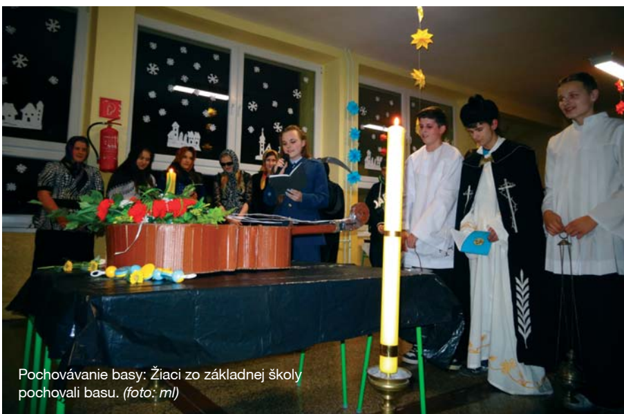
Pochovávanie basy: Žiaci zo základnej školy pochovali basu.

bali tradičné ľudové piesne, tance a zvyky, ktoré sa deti učia v rámci predmetu regionálna výchova. Po vyčerpávajúcom programe si všetci pochutnali na miestnych gurmánskych špecialitách, nechýbali posúchy, klobásy či šišky, po dlhopoľsky „vyškvárance“. Po občerstvení hľadisko v tme čakalo na hlavný bod programu: pochovávanie basy. Keď do miestnosti vošla smrť, mnohé deti v prvých radoch ani nedýchali. Sprievod pokračoval farárom a smútiacimi. Žiaci tento tradičný fašiangový zvyk okorenili svojským humorom a zábava na chodbe školy nemala konca kraja.