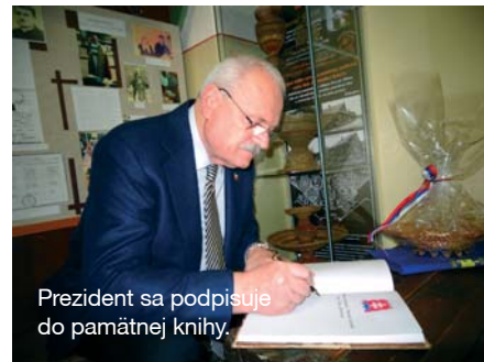
Prezident sa podpisuje do pamätnej knihy.