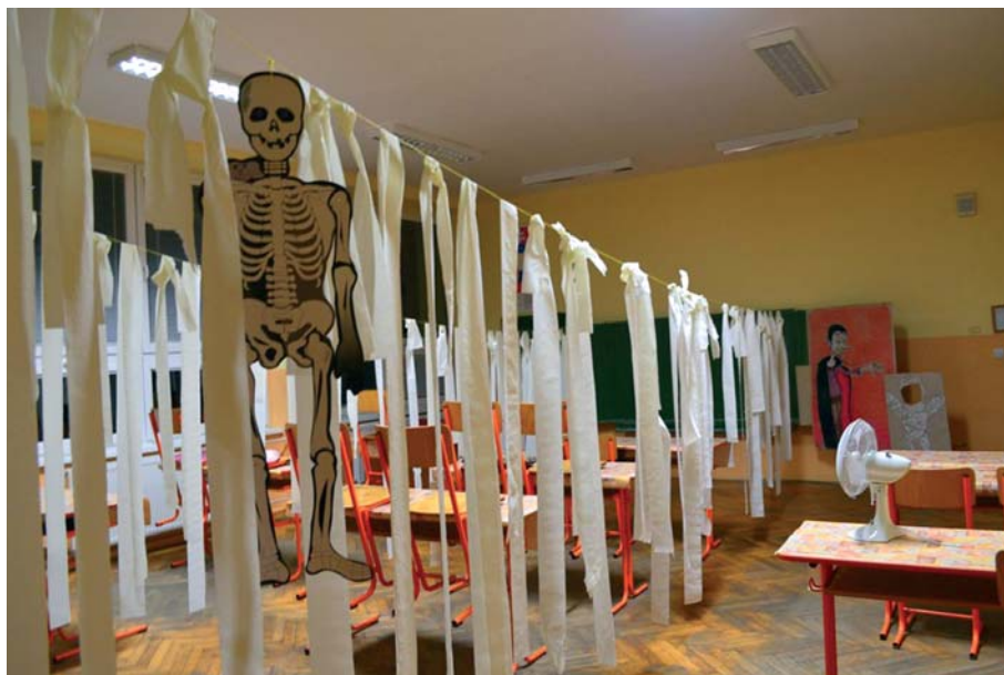
Žiaci zažili v škole strašidelnú noc.

Večer 29. októbra 2014 sa žiaci 4. A a 6. A vrátili späť do školy, kde na nich čakal pestrý program. Každá skupina nakreslila svojho strašidelného maskota a vymyslela príbeh, ktorý vyzprávala pred pozorným obecenstvom. Nasledovali rôzne súťaže a po nich strašidelná cesta po triedach osvetlených len nočným svetlom, čajovými sviečkami a baterkami. V triedach si testovali svoje zmysly, preliezali a podliezali rôzne prekážky a v kamarátskych tímoch spoločne prekonávali svoje obavy z nepoznaného. Nechýbalo ani podivné občerstvenie v podobe prstov, očí, či 6-nohých pavúkov. Nasledoval program, ktorí si žiaci pripravili sami – scénky, hľadanie pokladu a upírske naháňačky. Na záver si pozreli čiernobielu rozprávku a po nej sa zakuklili do svojich spacích vakov, aby ráno zvládli skoré vstávanie.