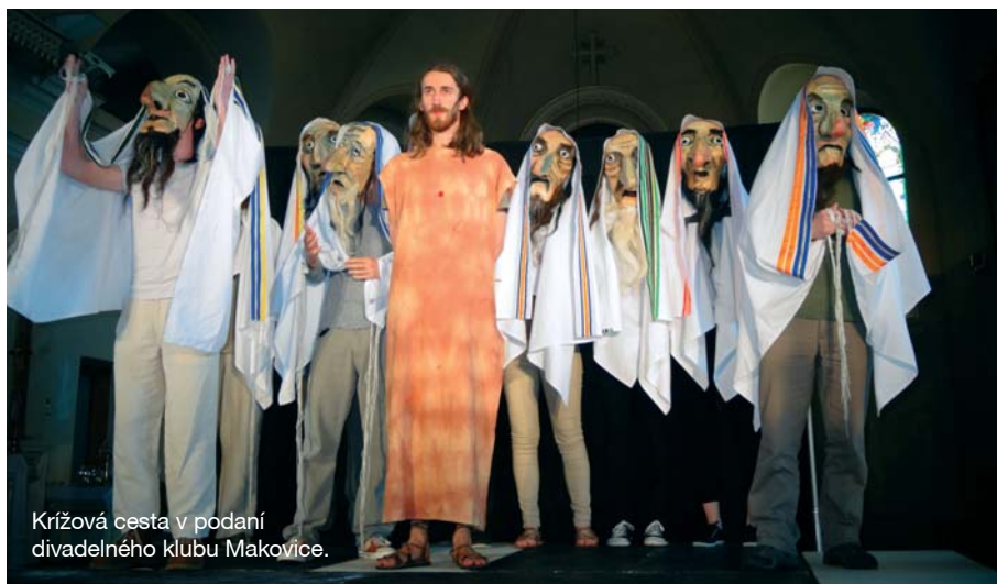
Krížová cesta v podaní divadelného klubu Makovice.