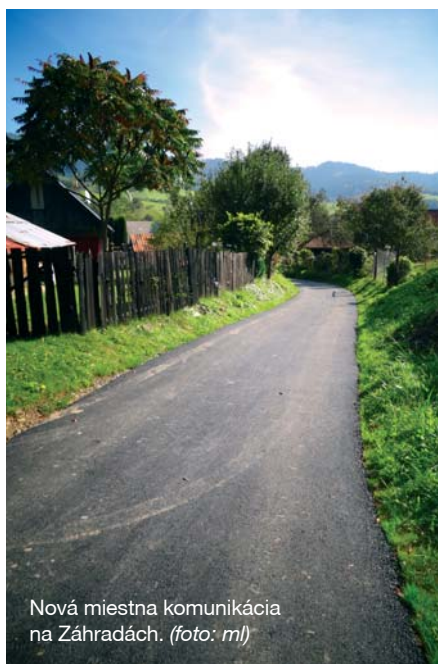
Nová miestna komunikácia na Záhradách.

Okrem toho bol vynovený vstup do zdravotného strediska a opravené výtlky v niektorých častiach miestnych komunikácií. Išlo najmä o cestu na cintorín a menšie opravy v uliciach. Náklady na tieto práce predstavovali 7 500 eur. Na opravu miestnych komunikácií v obci poskytli dotáciu aj Lesy SR š. p. a to vo výške 1 500 eur.