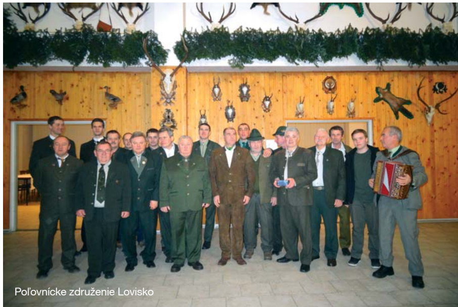
Poľovnícke združenie Lovisko