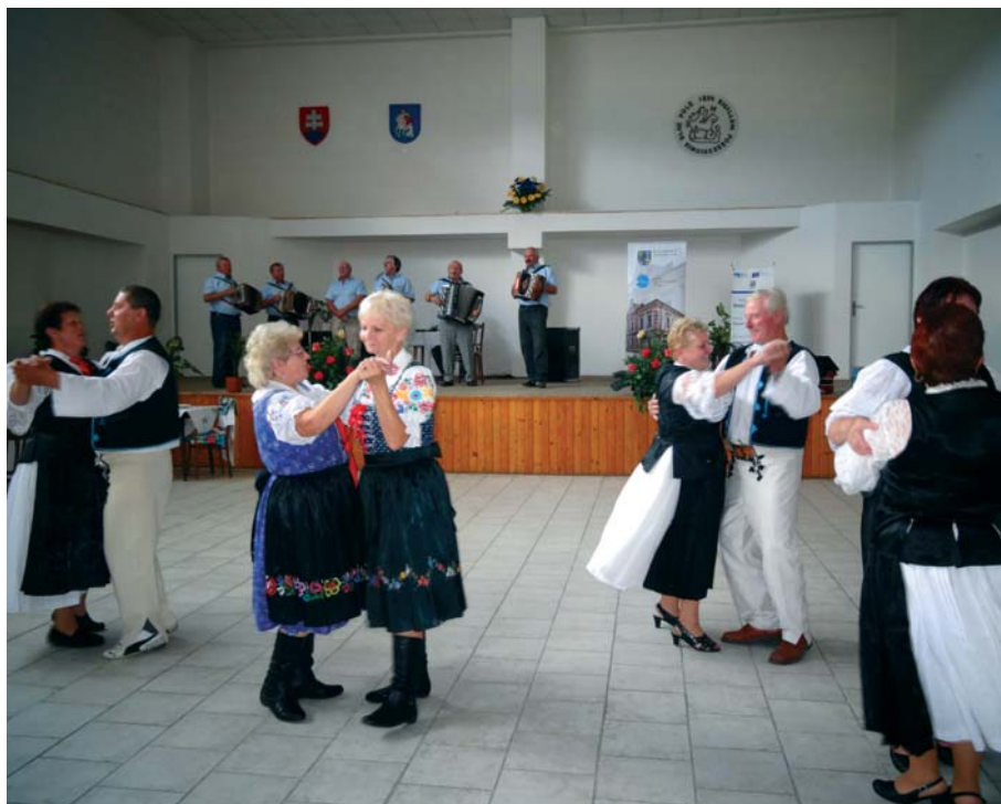
Pri ľudovej hudbe bolo v kultúrnom dome veselo.

Keďže všetky recepty boli nielen chutné, ale aj jedinečné, vybrať len jedného víťaza bolo veľmi náročné. Napokon zvíťazilo družstvo z Jablonového, ktoré pripravilo kapustnicu so zemiakovými pagáčikmi a úhrabkové pagáčiky. Do veľkého finále však postúpil aj tím z Kotešovej a ich krúpna baba a tiež domáca skupina z Dlhého Poľa, ktorá uvarila posúchy s kyslou kapustou. Porota však pochválila a odmenila všetky družstvá.