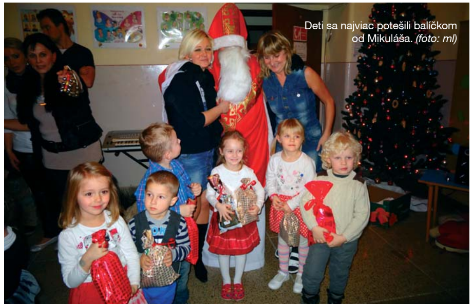
Deti sa najviac potešili balíčkom od Mikuláša.

Štvrtok 4. decembra 2014 prišiel do materskej školy Mikuláš. Na deduška v červenom čakalo vyše 40 detí a predvianočnú atmosféru vyčaroval rozžiarený stromček. Mikuláša najskôr privítali mladšie deti z triedy motýlikov piesňami a roztomilými scénkami. Pestrým vystúpením so vtipnými vsuvkami si ho získali i starší škôlkari z triedy včielok. Nechýbali ani veselé hudobné čísla detí zo súkromnej hudobnej školy YAMAHA. Na svoje si tak prišli všetci – príbuzní škôlkarov aj Mikuláš, ktorý bol dôležitou súčasťou programu. Deti totiž nič nepotešilo viac ako balíčky s dobrotami. Ochutnať však stihli aj koláče šikovných mamičiek a tiež zapožovať s Mikulášom.