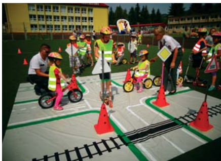
Súčasťou športového dňa bolo aj otvorenie dopravného ihriska za spolupráce policajtov KR PZ v Žiline.

Presne na poludnie začali v areáli školy športové hry pre deti, ktoré opäť otvorila starostka obce a deti súťažili v rôznych disciplínach. Nechýbal beh cez prekážky, preťahovanie lanom, hádzanie loptič-