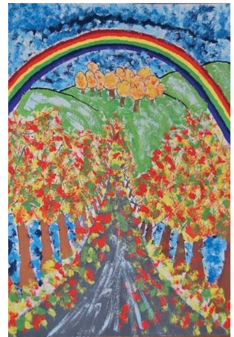
Príroda mojimi očami v podaní Dašky Rybárikovej.

Do výtvarnej súťaže „Hody v našej obci“, ktorú organizoval Farský úrad v Dlhom Poli sa zapojili deti zo základnej aj materskej školy. Ich práce boli vystavené v priestoroch kostola sv. Martina a hodnotili ich veriaci počas Hodovej nedele a nasledujúceho týždňa. Výsledky boli tesné a preto sa na prvých miestach umiestnilo viac detí: