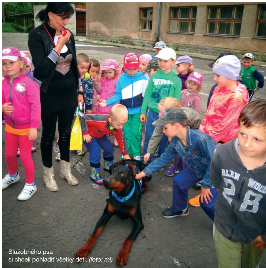
Služobného psa si chceli pohladit' všetky deti.