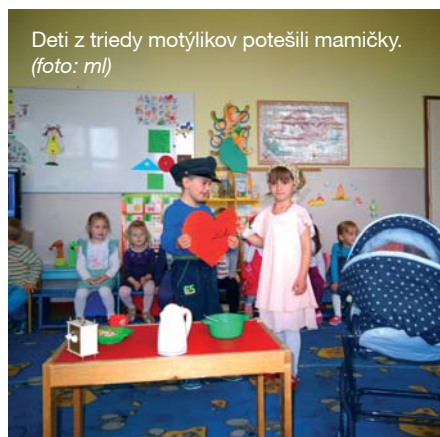
Deti z triedy motýlikov potešili mamičky.

V o štvrtok 15. mája 2014 sa v materskej škole zišli mamičky, staré mamy, dokonca aj zopár oteckov, aby si spríjemnili „upršané“ popoludnie vystúpením svojich ratolestí. Detičky z malej i veľkej triedy predviedli veselé pesničky, básničky, vtipné scénky a tance. Roztomilý program vyčaril úsmev na tvári všetkých mám a každá jedna bola na toho svojho škôlkara či škôlkarku nesmierne hrdá. Rýmovačky z detských úst „roztopili“ srdce nejednej starostlivej maminy, ktorú na záver dojala kvetinka za lásku. Obdarované boli aj babičky a popoludnie pokračovalo občerstvením a voľnou zábavou.