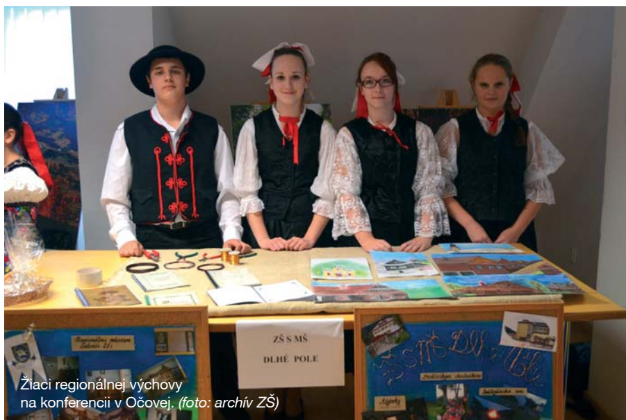
Žiaci regionálnej výchovy na konferencii v Očovej.