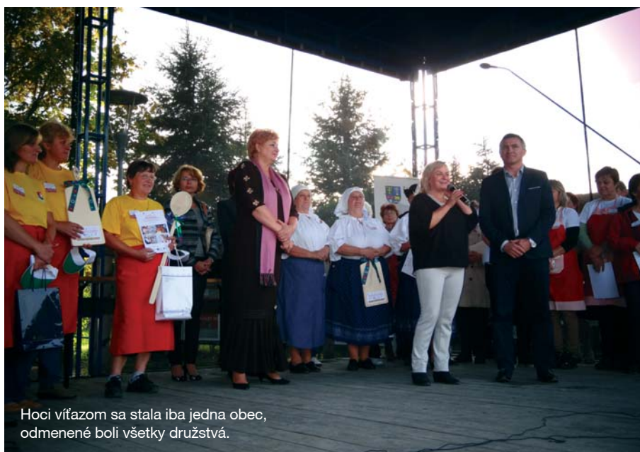
Hoci víťazom sa stala iba jedna obec, odmenené boli všetky družstvá.