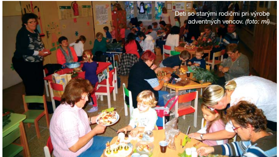
Deti so starými rodičmi pri výrobe adventných vencov.

V utorok 18. novembra 2014 sa materskou školou niesla vôňa činy a sviečok. Deti so svojimi starými rodičmi sa pripravovali na obdobie adventu a vyrábali vence rôznych veľkostí a druhov. Pri príjemnej hudbe a slovách o advente im to išlo skutočne od ruky. Babky boli veľmi kreatívne a spolu s vnúčatami vytvorili malé umelecké diela. Potom nasledoval krátky program, v ktorom sa škôlkari predstavili piesňami aj hudobným číslom. Uvoľnená atmosféra pokračovala, staré mamy dokončili vence a všetky výtvory boli napokon vystavené. Nejaký čas tak zdobili priestory materskej školy a inšpirovali jej návštevníkov.