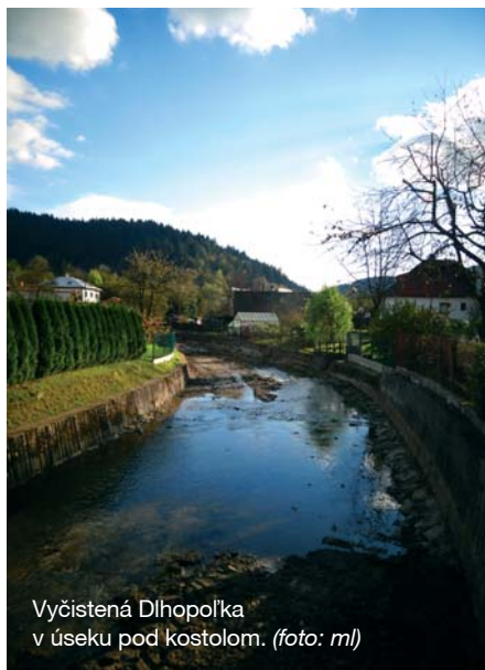
Vyčistená Dlhopolka v úseku pod kostolom.

U Boncov bola zakopaná a položená prepádová hadica. Celkové náklady na prevádzku vodovodov v roku 2014 činili okolo 25 000 eur.