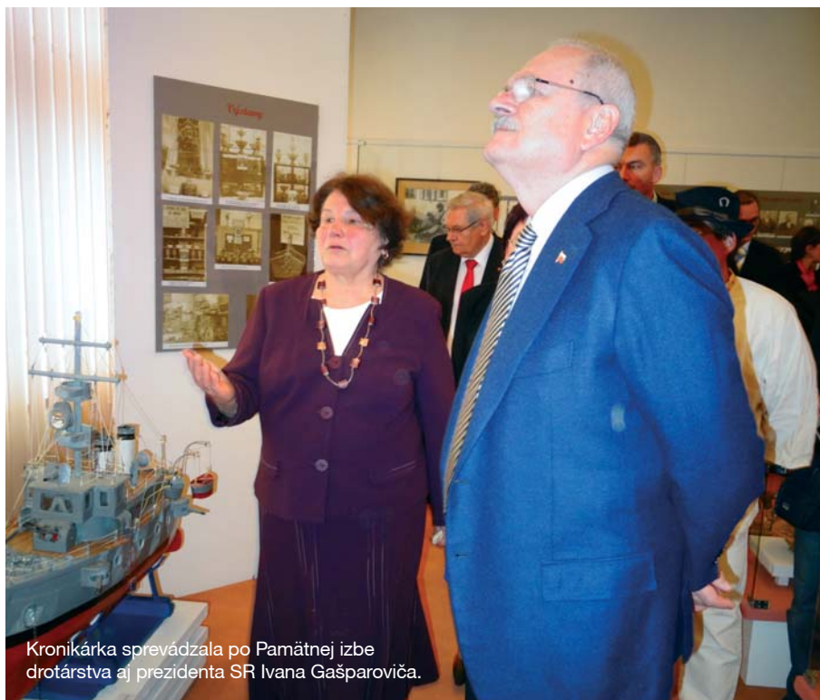
Kronikárka sprevádzala po Pamätnej izbe drotárstva aj prezidenta SR Ivana Gašparoviča.