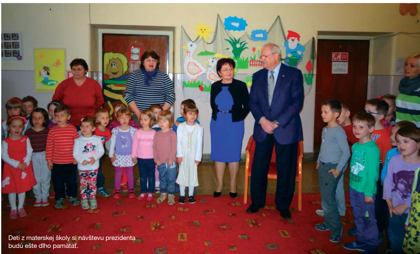
Deti z materskej školy si návštevu prezidenta budú ešte dlho pamätať.