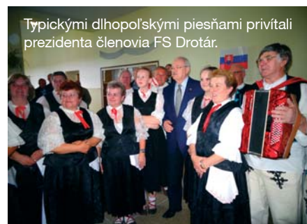
Typickými dlhopoľskými piesňami privítali prezidenta členovia FS Drotár.

N a štvrtok 10. apríla 2014 v obci len tak rýchlo nezabudneme. Dlhé Pole totiž navštívil prezident Slovenskej republiky Ivan Gašparovič. Takáto udalosť sa tu konala naposledy pred 74 rokmi, keď do obce pri príležitosti I. výstavy drotárstva prišiel Dr. Jozef Tiso.