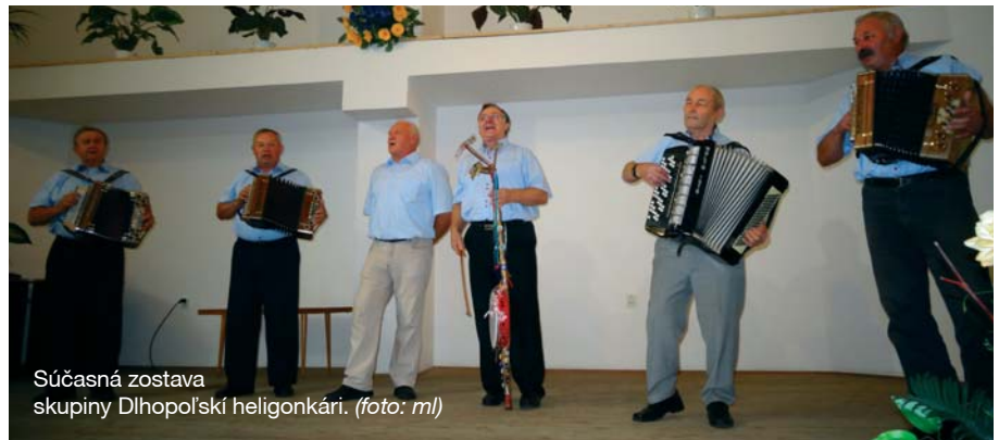
Súčasná zostava skupiny Dlhopolští heligonkáři.

chárska heligónka. Vystupovali taktiež v družobnej obci Opoj a na tohtoročnom Stretnutí dôchodcov. Dlhopolští heligonkáři chodievajú hrať na pozvanie aj na rôzne oslavy alebo podujatia mimo obce. V ich repertoári sú zväčša rezké piesne a pri niektorých vystúpe-