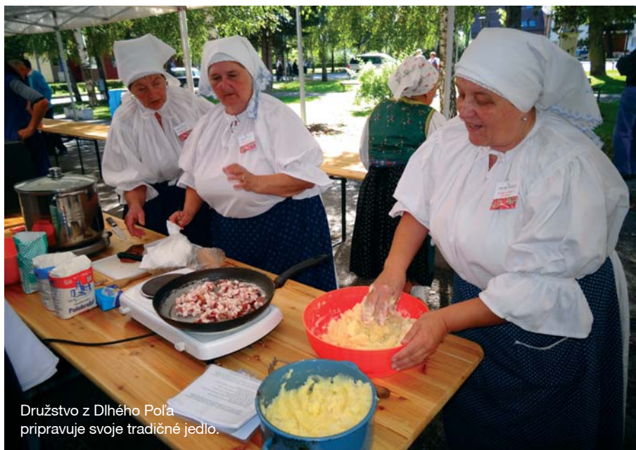
Družstvo z Dlhého Poľa pripravuje svoje tradičné jedlo.