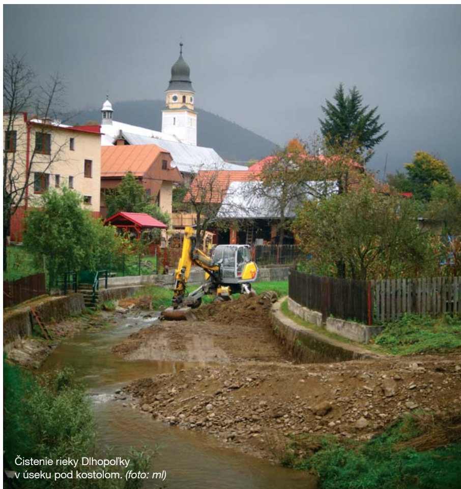
Čistenie rieky Dlhopolky v úseku pod kostolom.