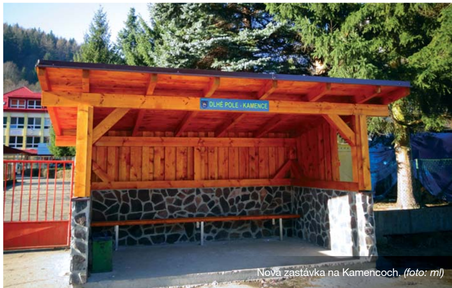
Nová zastávka na Kamencoch.

Každý rok realizujeme opravu miestnych komunikácií, či už vysprávky, alebo polozenie nového asfaltového koberca. V roku 2014 to bola miestna komunikácia na Záhrady a do zdravotného strediska. Celkové náklady aj s vysprávkami činili okolo 20 000 eur. Od Lesov SR sme dostali na miestne komunikácie dotáciu 1 500 eur.