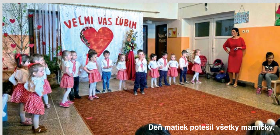
Deň matiek potešil všetky mamičky.