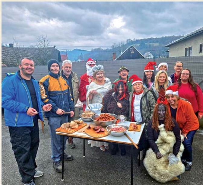
Pri varení kapustnice prišli kuchárov rozveseliť zamestnanci Domu seniorov.