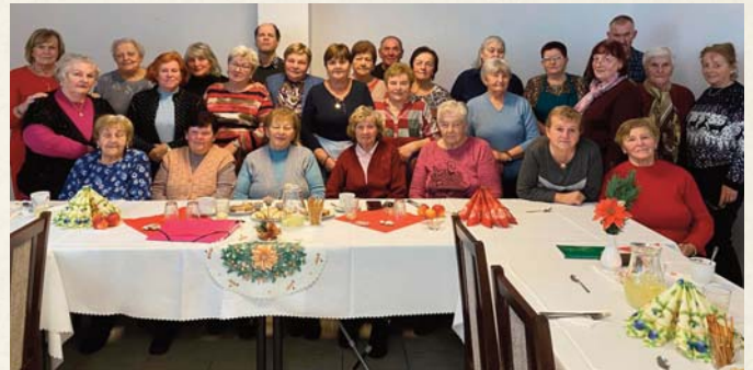
Predvianočné posedenie členov v kultúrnom dome v Dlhom Poli.