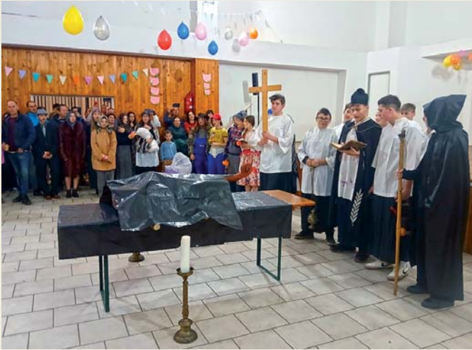
Dlhopolské fašiangovanie ukončilo Pochovávanie basy v podaní žiakov ZŠ Dlhé Pole.