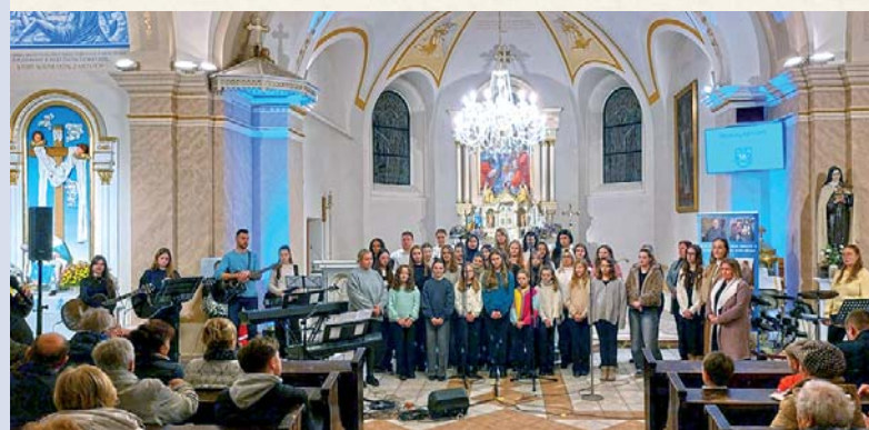
Hodový koncert potešil všetkých veriacich.