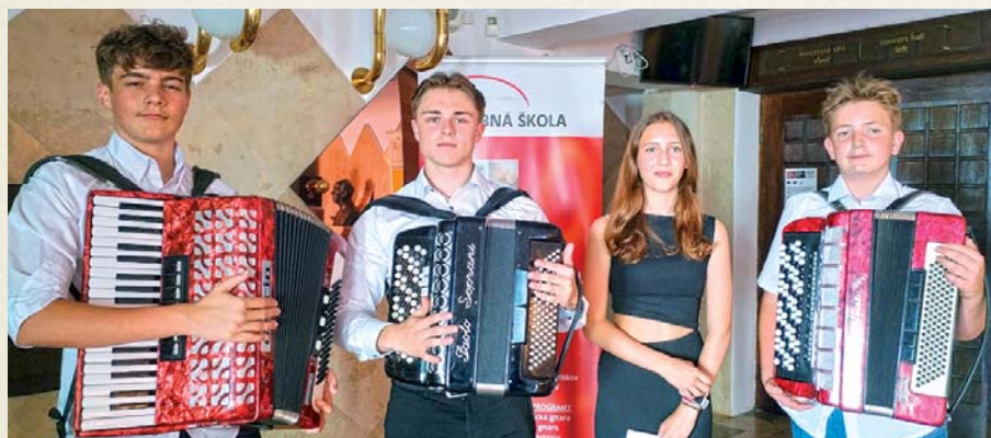
Absolventi v Dome umenia Fatra.

a počas roka prebiehali triedne besiedky pedagógov, na ktorých žiaci svojim vystupovaním získavajú cenné skúsenosti s prácou na pódii. Deti predškolských programov mali tiež dva spoločné koncerty v Žiline.