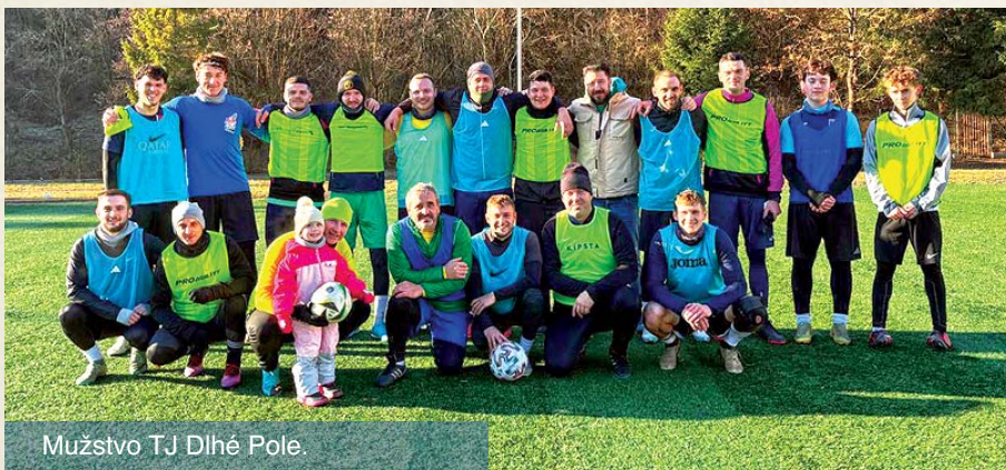
Mužstvo TJ Dlhé Pole.