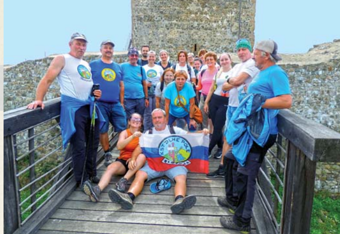
Členovia KST Dlhé Pole na Šarišskom hrade.

V roku 2025 sme mali 27 akcií. Rok začíname 1. januára výstupom na Zarúbanú Kýčeru, nasleduje Trojkráľové Kamenité a posledná januárová sobota patrí výstupu na Javorník, ktorý je zaradený i do regionálneho kalendára a teší sa hojnej účasti turistov a priateľov prírody nielen z obce, ale i širokého okolia. Posledné zimy s nedostatkom snehu neprajú bežeckému lyžovaniu, plánované podujatia sa preto neuskutočnili, okrem Drotárskej stopy, ktorá však bola na pešo. Cez Veľkonočné sviatky sme realizovali výstup na Šíp a šibačka vo Veľkej Fatre bola na vrchole Sidorova. Pokračovali sme zahájením turistickej sezóny na Lietavskom hrade a Petránkach na Kysuciach. Na Javorníku sa konala brigáda, ktorá spočívala vo vyčistení a úprave okolia. Autobusový zájazd smeroval do Strážovských vrchov oblasti Mojtína. V letnom období sa uskutočnil zraz vysokohorských turistov v Starej Lesnej, dvojdňovka Dlhopoľským chotárom, letná stanovačka či nočný výstup na Kamenité. Cieľom štvordňového výletu boli Slánske vrchy s výstupom na najvyšší bod Šimonku, ale i prechod Lačnovského kaňona, návšteva jaskyne Zlá diera, Slovenských opálových baní,