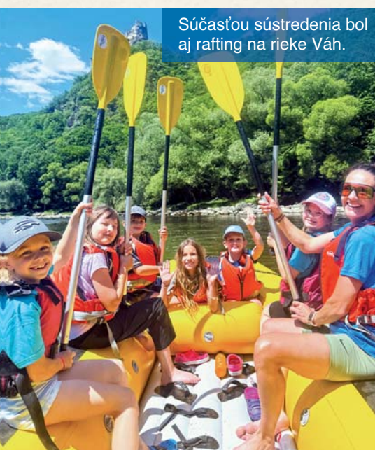
Súčasťou sústredenia bol aj rafting na rieke Váh.