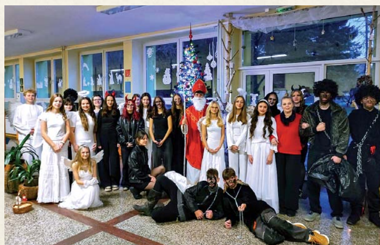
Na Mikulášsky deň v podaní žiakov 9. triedy sa teší celá škola.