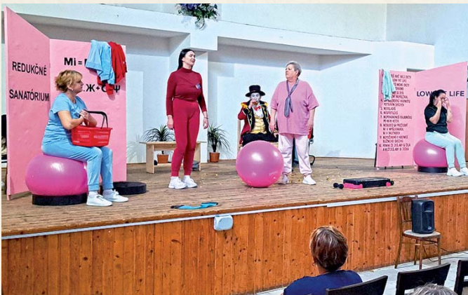
Divadelné predstavenie Nízkoťučný život zabavilo občanov obce.