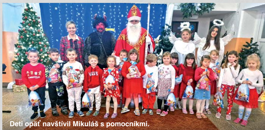
Deti opäť navštívili Mikuláš s pomocníkmi.