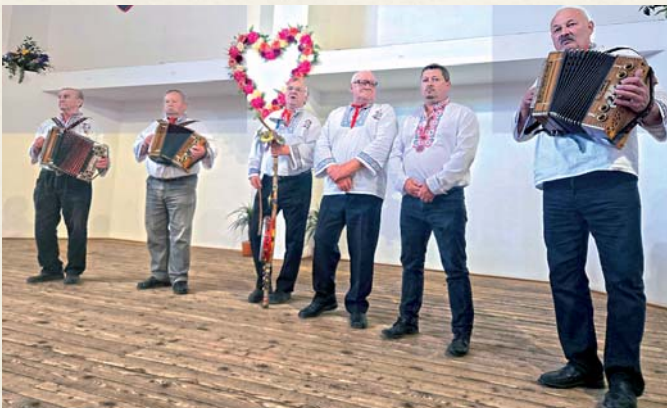
Na Deň matiek potešili dámy v publiku aj Dlhopolští heligonkári.