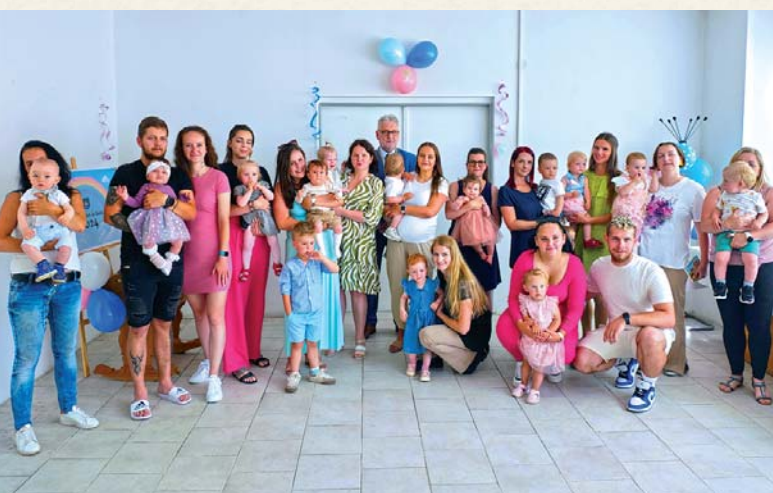
Tradičné Uvítanie detí do života v kultúrnom dome v obci.