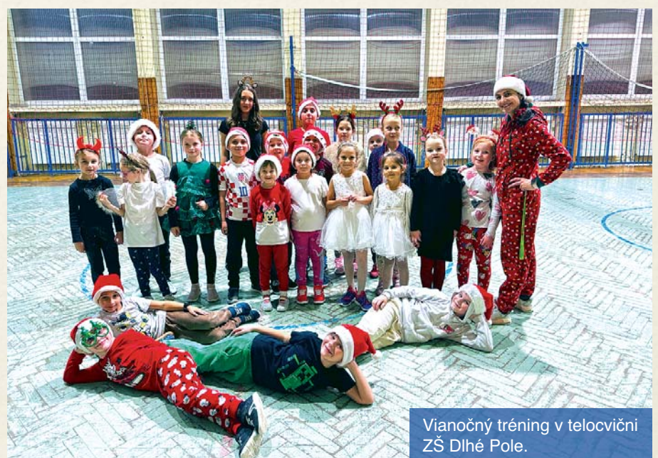
Vianočný tréning v telocvični ZŠ Dlhé Pole.