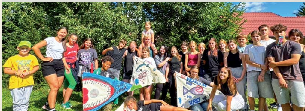
Tradičný tábor sa tento rok konal v Ochodnici.