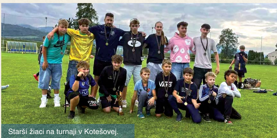
Starší žiaci na turnaji v Kotešovej.