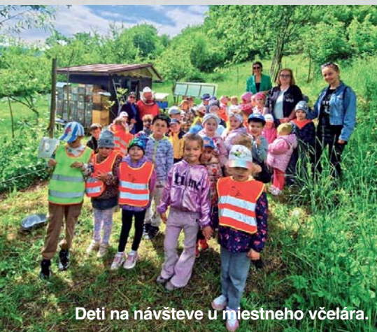
Deti na návšteve u miestneho včelára.

Materskú školu navštevuje v školskom roku 2025/2026 až 54 detí, ktoré sú organizované v troch triedach a venuje sa im päť pedagogických zamestnancov.