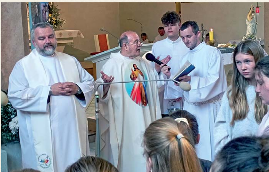
Z posväcovania obrazu sv. Františka z Assisi v Kostole sv. Martina v Dlhom Poli.

pokrstených, žijúcich v tomto kúte sveta a túžiacich po nebi. Tiež často nervózni a neistí, smutní a nahnevaní na to, čo sa deje, alebo čo nás čaká. Neistí z toho, či tento rok 2026 nebude náš posledný.