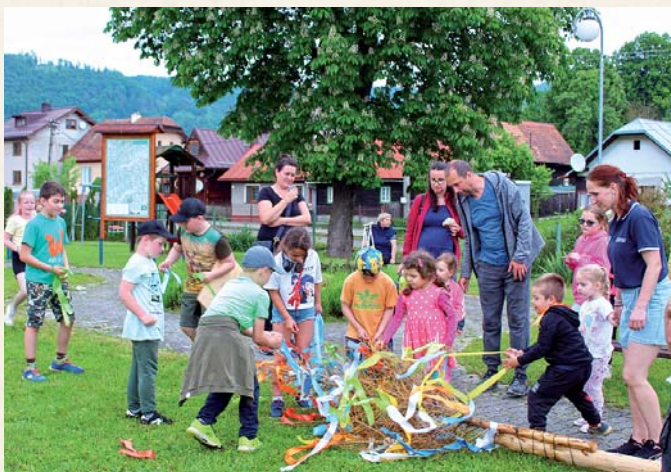
Po zvalení mája mali deti radosť z odväzovania stužiek.