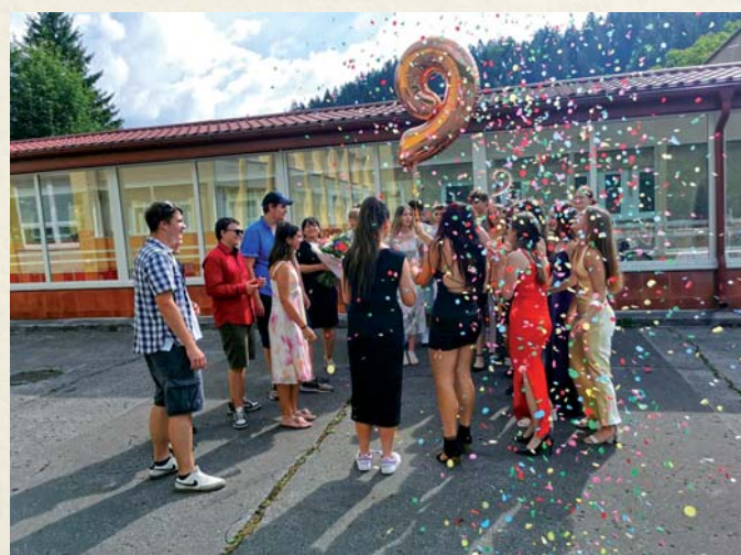
Deviataci sa lúčili so základnou školou.

V októbri sa naplno rozbehli rôzne exkurzie. Starší žiaci navštívili Drotárske múzeum J. H.-Bakeľa, deviataci boli v Považskej galérii a ôsmaci na výstave Tutanchamón v Bratislave. Mesiac úcty k starším sa prejavil vo výtvarných aktivitách a prvý stupeň sa opäť zapojil do projektu Záložka do knihy spája školy. Žiaci druhého stupňa spoznali na hodinách anglického jazyka Halloween a šiestaci so siedmami si užili exkurziu do Veľkého sveta techniky v Ostrave. V novembri sa niekoľko starších žiakov zapojilo do Behu 17. novembra v Žiline. Piatáci pripravili v rámci regionálnej výchovy hody a nechýbal ani tradičný Dušičkový pochod ku krížom v chotári. Deviatci po anglicky predstavili mladším žiakom Nežnú revolúciu. Žiaci šiestej triedy si v rámci pohybového krúžku vybili energiu v Hoplandii a piatáci navštívili zážitkové centrum MOTIO na Žilinskej univerzite. December priniesol do školy obľúbený Mikulášsky deň a najstarší žiaci školy si vyskúšali zdobenie vianočných gúľ na exkurzii v Okrase Čadca. Deti z 8. triedy sa zabavili v kine aj na hokejovom zápase a birmovanci sa zúčastnili zájazdu farníkov do Tatier a Popradu.