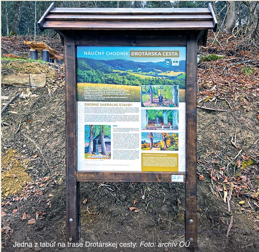
Jedna z tabúľ na trase Drotárskej cesty.

Viac informácií o projektoch nájdú občania na www.obecdhlhepole.sk