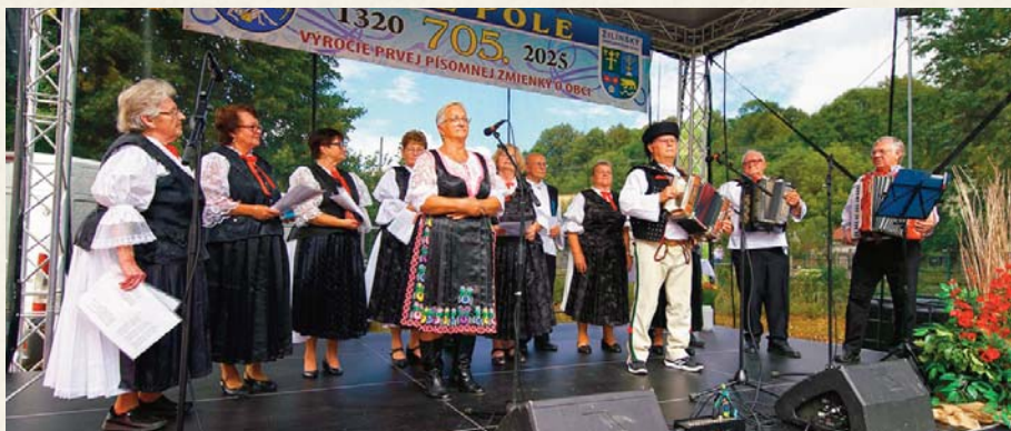
Kultúrny program otvorila miestna folklórna skupina Drotár.