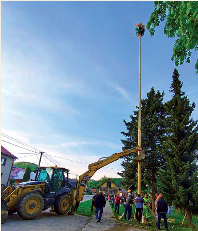
Pri stavaní mája pomohli dobrovoľníci aj ťažká technika.