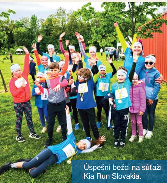
Úspešní bežci na súťaži Kia Run Slovakia.