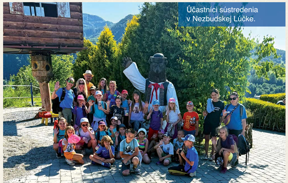
Účastníci sústredenia v Nezbedskej Lúčke.