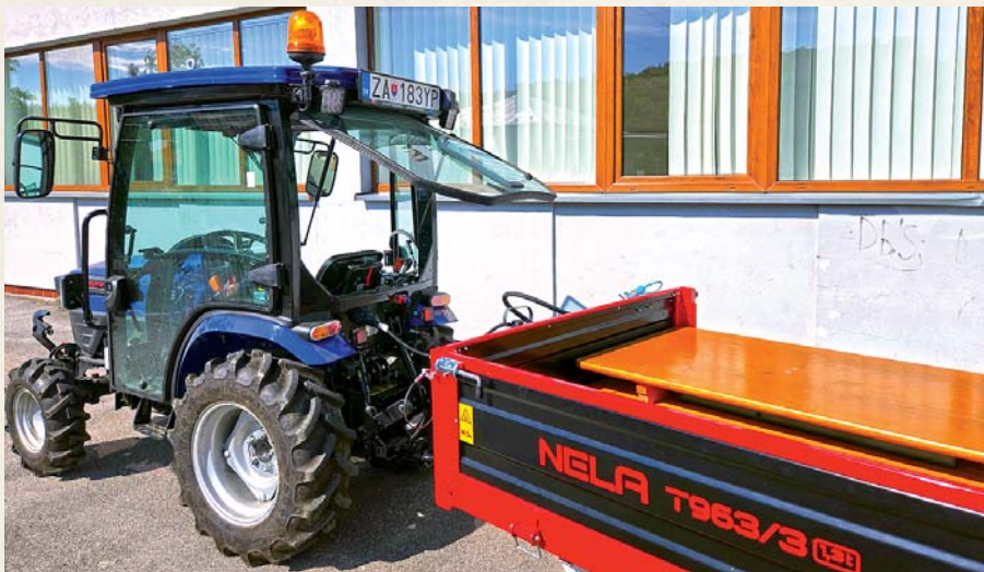
Malotraktor sa bude používať najmä na manipuláciu s odpadom.

Projekt podporený z Environmentálneho fondu