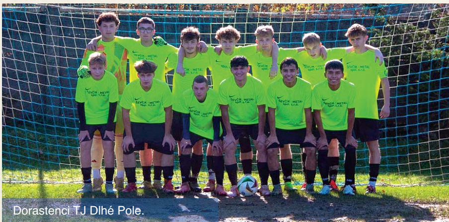
Dorastenci TJ Dlhé Pole.