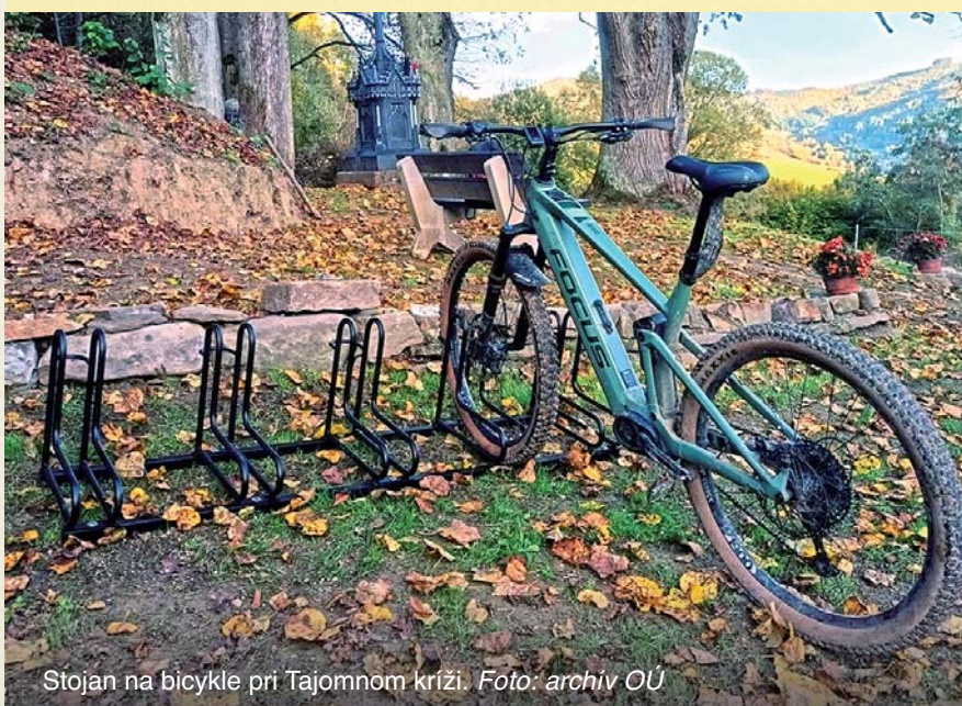
Stojan na bicykle pri Tajomnom kríži.