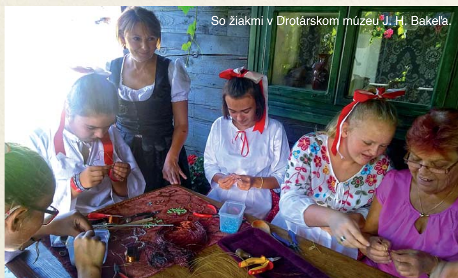
So žiakmi v Drotárskom múzeu J. H. Bakela.