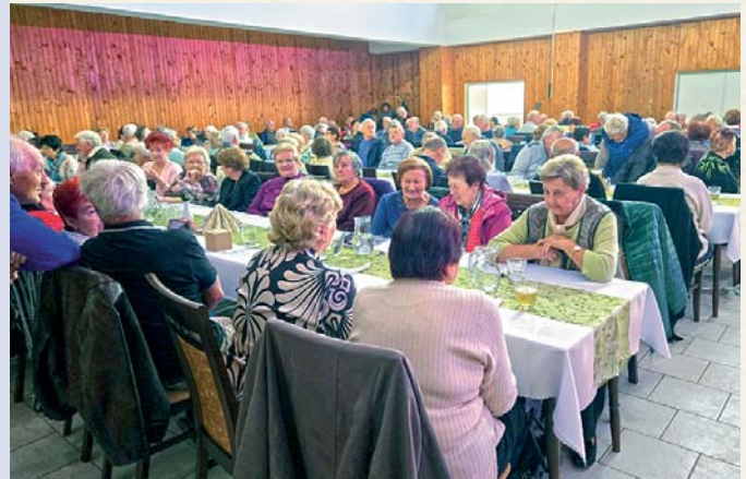
Seniori strávili príjemný deň v spoločnosti rovesníkov.