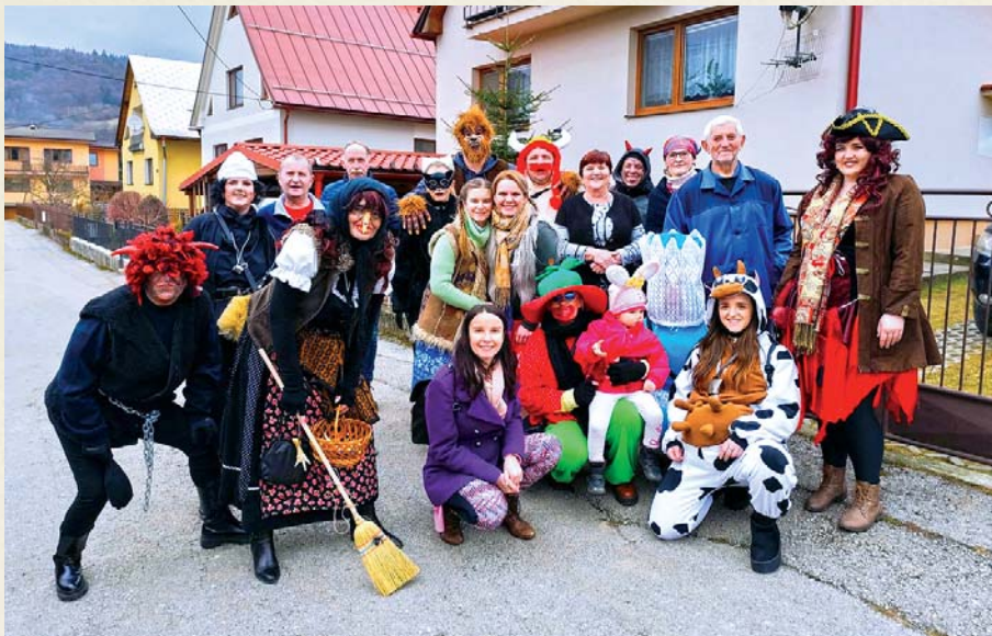
Fašiangový sprievod v podaní Dlhopolci o. z. opäť potešil obyvateľov obce.

Občianske združenie DLHOPOĽCI o. z. má za sebou ďalší rok, ktorý nám opäť potvrdil, že Dlhé Pole nie je len miestom na bývanie, ale najmä živou komunitou ľudí, ktorým záleží na vzťahoch, tradíciách a spoločných zážitkoch. Počas uplynulého roka sme mali možnosť zorganizovať tri krásne podujatia, z ktorých každé malo svoju jedinečnú atmosféru, energiu a silu spájať.