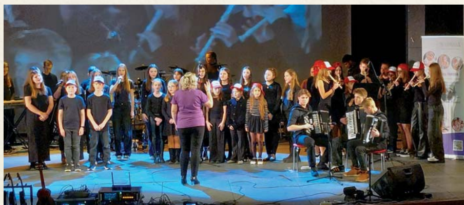
Slávnostný koncert pri príležitosti 25. výročia školy.