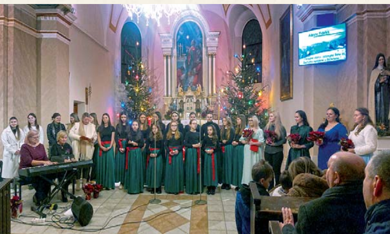
Koncert Nádej Vianoc naplnil prítomných láskou a dobrom.