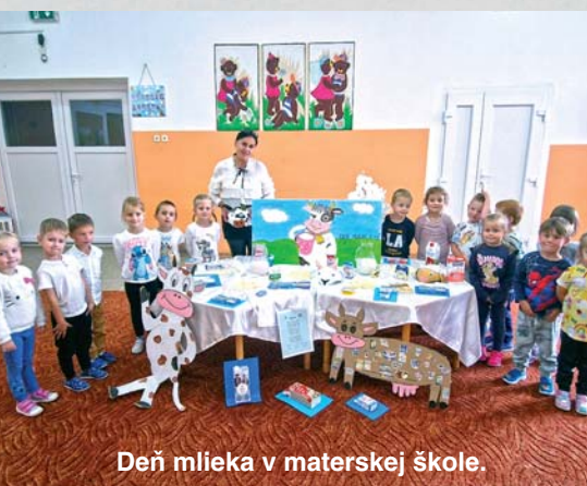
Deň mlieka v materskej škole.