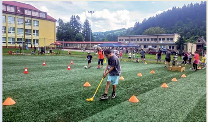
Na Športovom dni detí sa súťažilo v rôznych kategóriách.